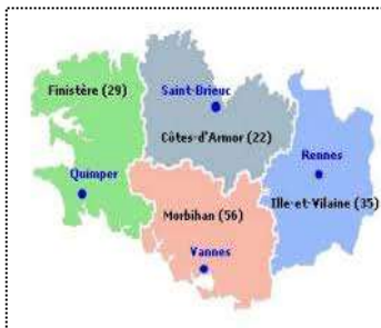
Carte de la région de Bretagne