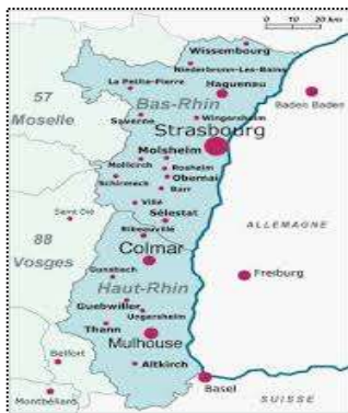
Carte d'Alsace Capitale: Strasbourg