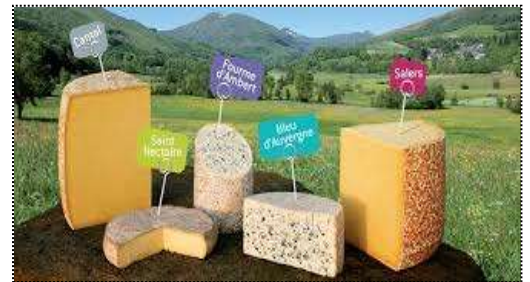
Fromages d'Auvergne: Le Cantal, Le Bleu d'Auvergne, la Fourme d'Ambert, Le Nectaire, Salers

Nouvelle- Aquitaine: Cette région compte de nombreux produits des terroirs et sans doute des vins tels que Jurançon, Sauternes, vins de Bordeaux et d'Armagnac.