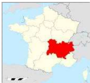
Carte d'Auvergne-Rhône-Alpes Saint