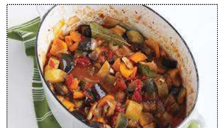
Ratatouille : Plat à la base des légumes du sud de France