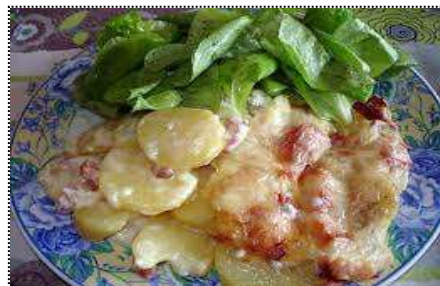
Truffade Auvergnate: Préparée à base de pommes de terre, fromage auvergnat et lardons