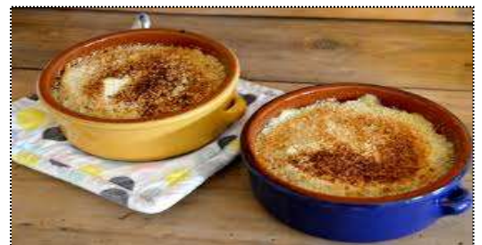
Confit de canard en cassolette: plat à base de cuisses de canard, Pommes de terre, saupoudré d'ail et de persil.