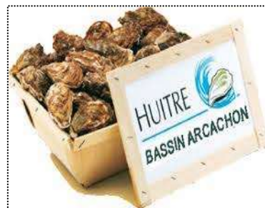
Huîtres du Bassin d'Arcachon