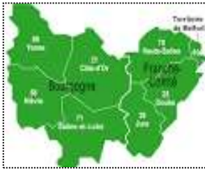
Carte : Bourgogne Franche-Comté

Bourgogne Franche-Comté : Cette région est très connue pour de grands vins tels que Chablis, Nuits-Saint-Georges ou le Pouilly.