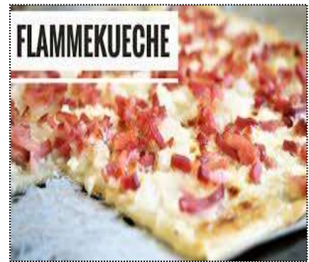
Flammekueche: Pizza à la pâte fine garnie d'oignons et des lardons