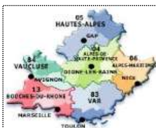
Carte : Provence- Alpes-Côte d'Azur