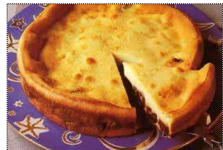
Far Breton: Gâteau de flan avec des pruneaux