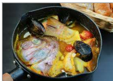
Bouillabaisse : Soupe de poissons très souvent la pêche du jour