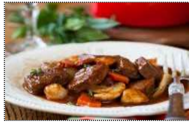
Bœuf bourguignon : viande de bœuf cuisiné au vin rouge de Bourgogne