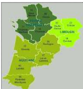
Carte de la région Nouvelle-Aquitaine

Nouvelle- Aquitaine: Cette région compte de nombreux produits des terroirs et sans doute des vins tels que Jurançon, Sauternes, vins de Bordeaux et d'Armagnac.