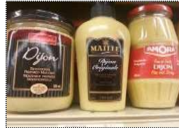
La moutarde de Dijon