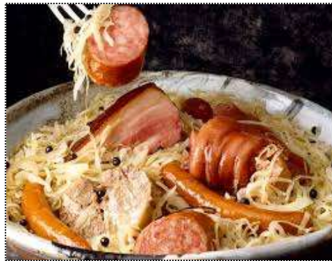
Choucroute : Préparée de saucisses, de différentes viandes, de charcuteries et de pommes de terre