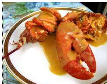
Homard à l'Armoricaine